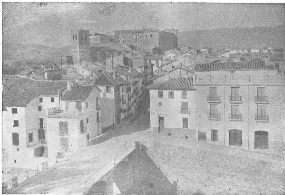
Vista general de Mora de Rubielos